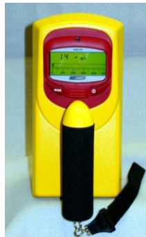
Model 451P & 451P-DE-SI Ion Chamber Survey Meter