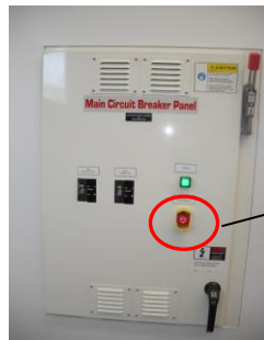
Bouton disjoncteur OFF